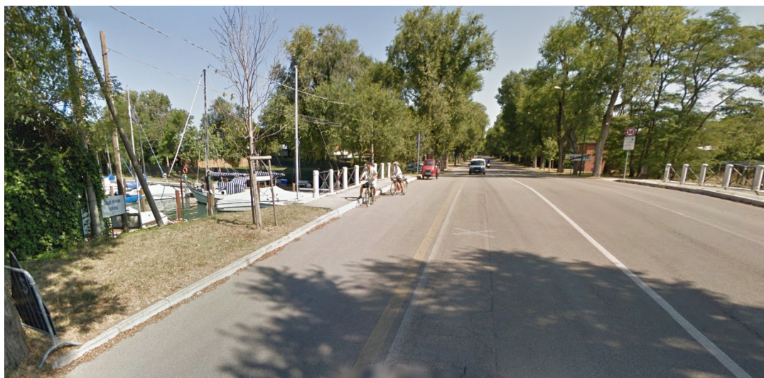
Immagine storica ricavata da Google Maps

Si segnala infine che, in quel tratto, era già prevista una corsia ciclabile come si evince dall'immagine storica ricavata da google maps e che si riporta di seguito.