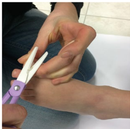
Fig 2 Il taglio delle unghie degli alluci con forbici in ceramica.

I Responsabili delle Macroaree e dei Quartieri del Comune di Forlì hanno messo a disposizione locali e volontari per la raccolta dei campioni. I genitori che hanno aderito all'iniziativa hanno condotto i figli nelle sedi dei quartieri predisposte, secondo gli orari (pomeridiani) ed i giorni previsti, comunicati preventivamente con un calendario ben pubblicizzato. Il genitore ha firmato una duplice copia di consenso informato, avendo ricevuto le informazioni richieste su finalità, modalità e rischi/benefici, ed ha compilato il questionario, atto a verificare possibili situazioni ambientali o di stili di vita o di comportamento utili per la successiva valutazione dei dati. Il prelievo è avvenuto, da parte del genitore, con il taglio superficiale delle unghie degli alluci mediante forbici con lamine in ceramica, lavate e passate in una soluzione debolmente acida disinfettante (acido acetico al 10%) fra un taglio e l'altro (Fig 2). I frammenti di unghie sono stati riposti in una piccola provetta con tappo a vite. Su ogni provetta, sul relativo questionario e sulla duplice copia del documento di informativa e consenso informato è stata posta una etichetta identificativa con una lettera (indicante la sede di prelievo) ed un numero progressivo.